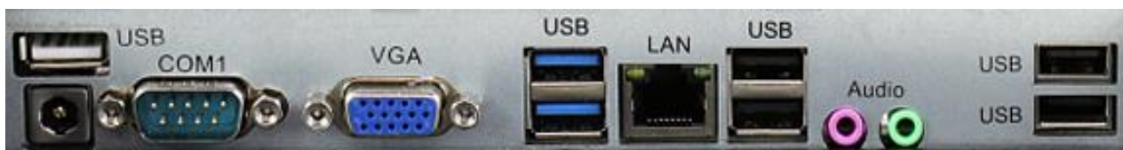
Рисунок 2. Панель с разъемами для подключения внешних устройств

В разделе приведено описание внешних разъемов.